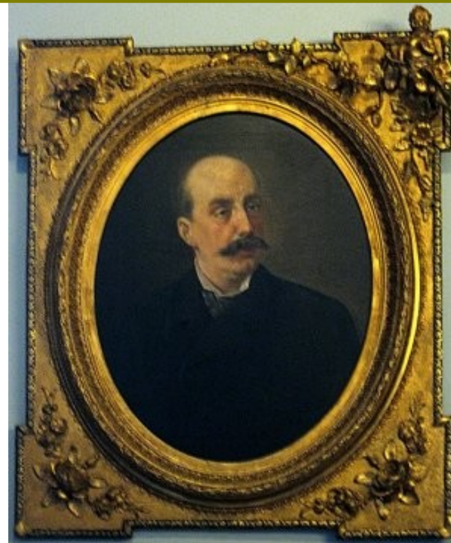
Retrat de Rosend Arús i Arderiu

El 1886 , a Barcelona, es constitueix la Gran Llotja Simbòlica Regional Catalana-Balear , presidida per Rosend Arús , amb uns principis avançats basats en els drets humans, les llibertats democràtiques, el laïcisme, l'abolició de la pena de mort i el dret d'autogovern i federació dels pobles . A més, proclama com a objectiu que Catalunya esdevingui un estat sobirà dins una federació ibèrica.