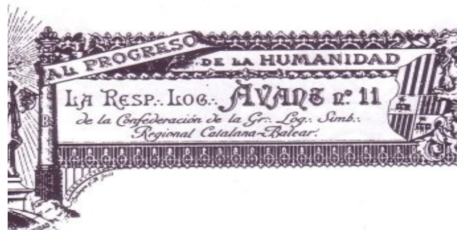
Logo de la Respectable Llotja Avant nº11 de la Gran Llotja Simbòlica de Catalunya i Balears

Amb la victòria franquista (1939) , la maçoneria és durament reprimida: perseguida, prohibida i pràcticament exterminada a Catalunya durant més de quaranta anys .