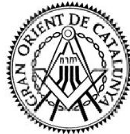
Logo del Gran Orient de Catalunya