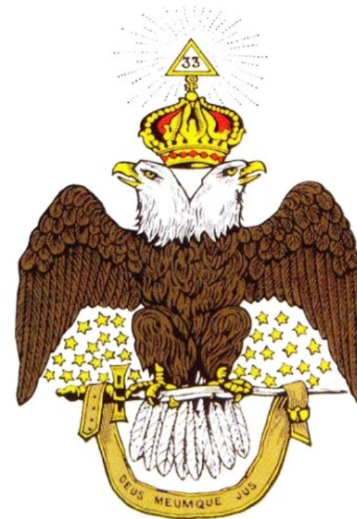
L'àguila bicèfala, símbol associat amb el Ritu Escocès i emblema del Suprem Consell del Grau 33

Avui, mentre algunes obediències mantenen una lectura estricta de la tradició, moltes altres entenen la francmaçoneria com una institució viva, compromesa amb la reflexió filosòfica , la solidaritat humana i l'adaptació als reptes de la societat contemporània.