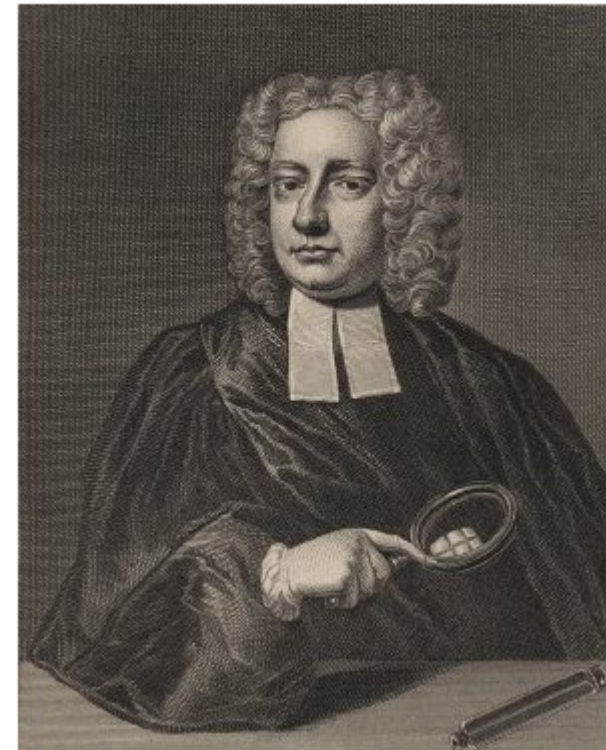
J. T. Desaguliers , científic i corredactor de les anomenades Constitucions d'Anderson

Els fonaments de la francmaçoneria moderna se situen al voltant de l'any 1600 a Escòcia . El 1717 , amb la creació de la Gran Llotja de Londres , s'institucionalitza la primera federació de lògies especulatives. El 1723 , les Constitucions d'Anderson estableixen els principis bàsics de l'Orde.