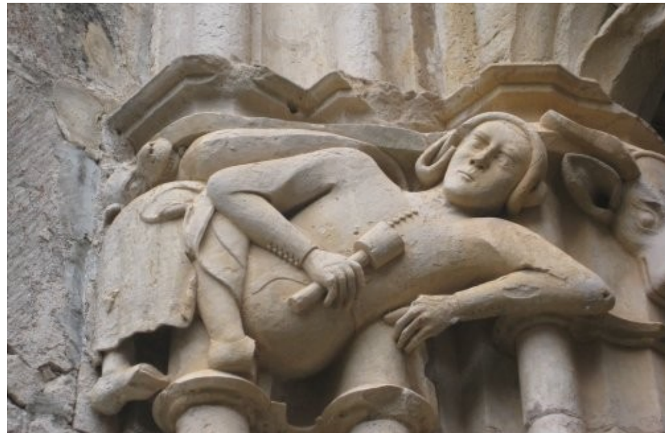
Representació del mestre d'obres del claustre del Monestir de Santes C reus , l'anglès Reinard des Fonoll

El caràcter itinerant dels maçons els va afavorir l'alliberament progressiu del control feudal i eclesiàstic, donant lloc als anomenats “ oficis francs ”.